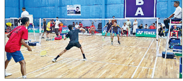
रोहतक। बैडमिंटन प्रतियोगिता में प्रतिभा का प्रदर्शन करते खिलाड़ी।