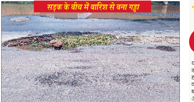
सड़क के बीच में बारिश से बना गड्ढा