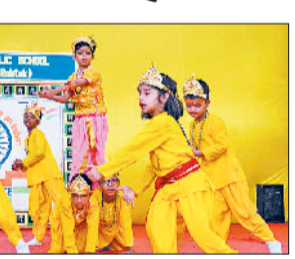
महम। कार्यक्रम प्रस्तुत करते एचडी स्कूल के विद्यार्थी।