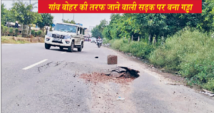
गांव बोहर की तरफ जाने वाली सड़क पर बना गड्ढा