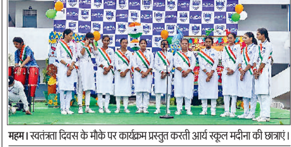
महम। स्वतंत्रता दिवस के मौके पर कार्यक्रम प्रस्तुत करती आर्य स्कूल मदीना की छात्राएं।