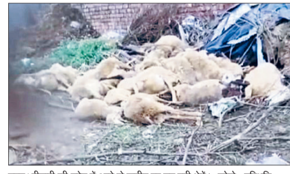
महम। बीमारी की चपेट में आने से जमीन पर मृत पड़ी भेड़ें।